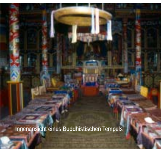
Innenansicht eines Buddhistischen Tempels