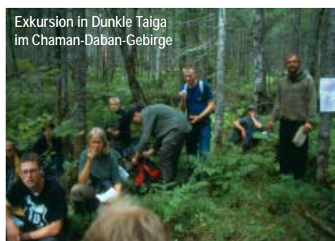
Exkursion in Dunkle Taiga im Chaman-Daban-Gebirge

Dieser Tag führt uns von Irkutsk ins Irkut-Tal. Das Irkut-Tal liegt im Hochgebirge des Sajans. Geologischer Aufschluß: Kohleflöze des Irkut-Beckens. Beispiele für Übernutzung: Birkentaiga im Primorskij-Gebirge Ü: 4 Nächte am Ufer des Irkut