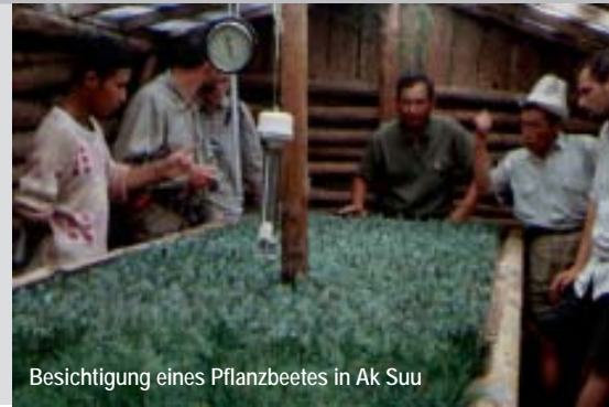
Besichtigung eines Pflanzbeetes in Ak Suu

Geleitet wird diese Exkursion von einheimischen Wissenschaftlern der Akademie der Wissenschaften Kyrgyzstans. Im Vordergrund stehen die natürliche Ausstattung (Flora, Fauna, Geomorphologische und geologische Phänomene) und wirtschaftliche Nutzung (Forstwirtschaft, Landwirtschaft, traditionelle Wirtschaftsweisen) in den einzelnen geographischen Zonen bzw. Naturräumen des beeindruckenden Tien Schans: Halbwüsten, Wiesensteppen, Hochgebirgssteppen, Zone der Nadelwälder mit der endemischen Tien Schan-Fichte, Zone der Wacholder-Buschwälder, subalpine und alpine Wiesen. Einige der Exkursionspunkte werden in wunderschönen Trekkingtouren erschlossen. Außerdem bleibt noch Zeit, viel Wissenswertes über Brauchtum, Riten und den kargen Alltag der Nomaden zu erfahren. Die Kyrgyzstan-Exkursion vereint zwei Programme und demzufolge auch zwei Gruppen: die landschaftsökologische und die kulturhistorisch-ethnographische.