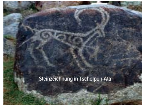
Steinzeichnung in Tscholpon-Ata

Transport der Fahrräder und Ausrüstung per Begleitfahrzeug zum Manas-Flughafen Bischkek und Abflug nach Europa.