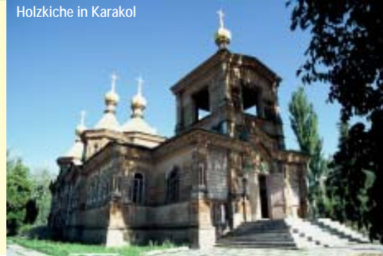
Holzkirche in Karakol