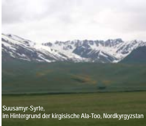
Suusamy-Syrte, im Hintergrund der kirgisische Ala-Too, Nordkyrgyzstan

Barskoon (1640 m NN) auf ebener Straße entlang des Seeufers. Unser erstes Ziel ist eine Filzmanufaktur. Hier werden seit Jahrhunderten die berühmten Schyrdak und Kijz (dt.: Filzteppiche) hergestellt. Man kann in der Manufaktur die Filzherstellung und das Zusammennähen der Teppiche beobachten. Später kommen wir an 50 m hohen Seeablagern vorbei, welcher sich in einer Steilwand direkt an der Straße aufwärts. In einem weiteren Dorf haben wir Gelegenheit, eine der wenigen Manufakturen zur Herstellung von Jurten zu besuchen. Hier wird alles vom Holzgestell bis zur Innenverkleidung einer Jurte hergestellt. Ü: Zeltcamp am Issyk-Kul